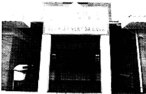
A Escola Municipal de Educação Infantil Zulmira Nery da Silva, situada na Rua Sadi Antonio Arnoldo, s/n, Bairro Goulart – Esmeralda RS, fone: 54 3354 1464